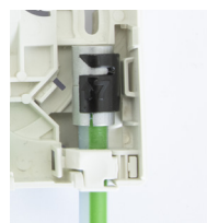
Mikrorohr mit Gasblocker